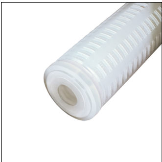
Plana (para 213)