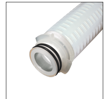
222 (3 pestañas)