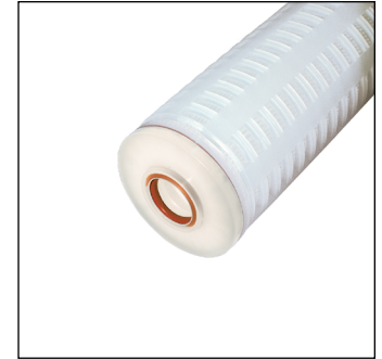
Junta tórica interior 213