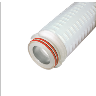
226 (con inserto SS)