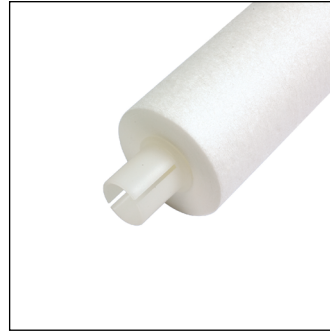
PP, extensor de núcleo