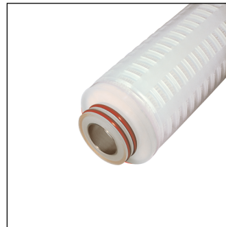
222 (con inserto SS)