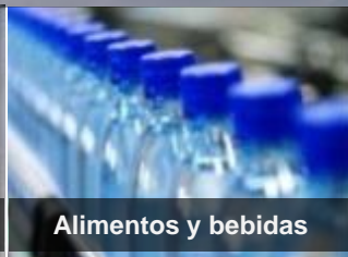
Alimentos y bebidas